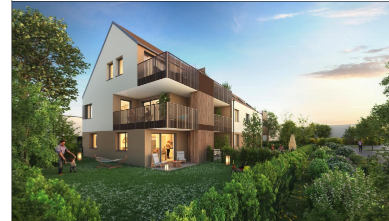
BÂTIMENT B / N° 102 / T3 / RDC