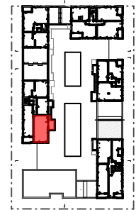
plan de repérage