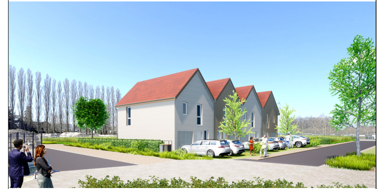
MAISON M02 4 PIECES