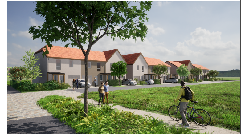
MAISON - M05 4 PIECES

Lotissement "les Poteries" rue du Chemin de Fer 67620 SOUFFLENHEIM